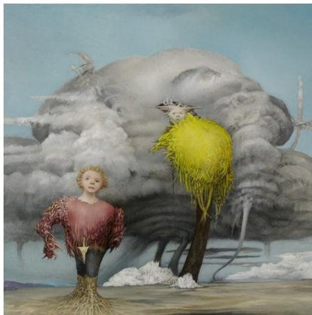
“Après le déluge”

Inaugurazione presso DAC Gallery sabato 15 Giugno dalle 18.00 alle 21.00. (la mostra proseguirà fino al 11 Luglio 2013)